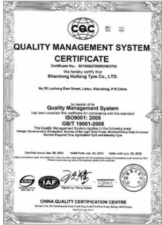
CERTIFICATE / CERTIFICADO ISO