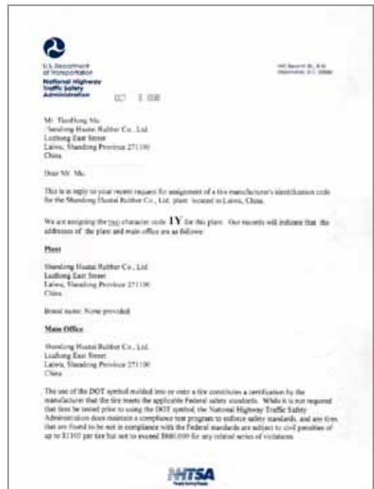
CERTIFICATE / CERTIFICADO DOT