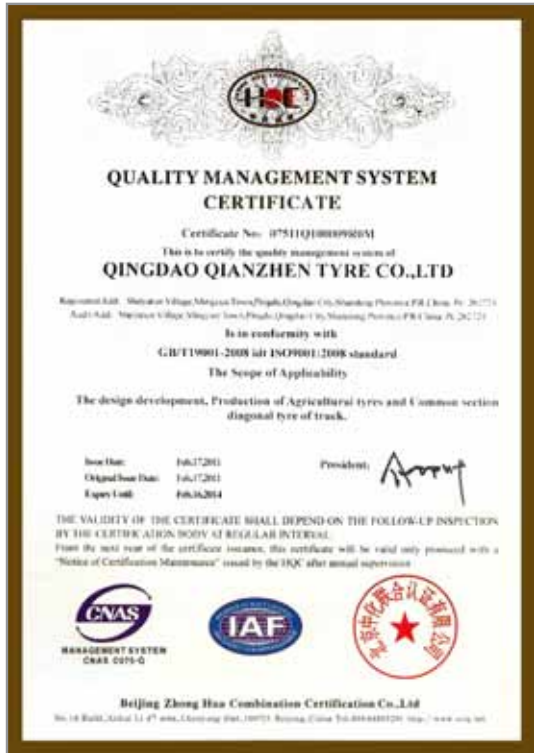
CERTIFICATE / CERTIFICADO ISO