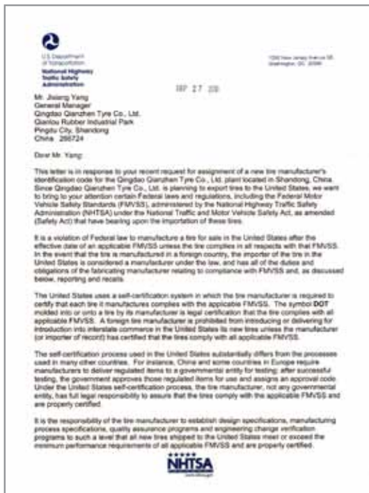
CERTIFICATE / CERTIFICADO DOT